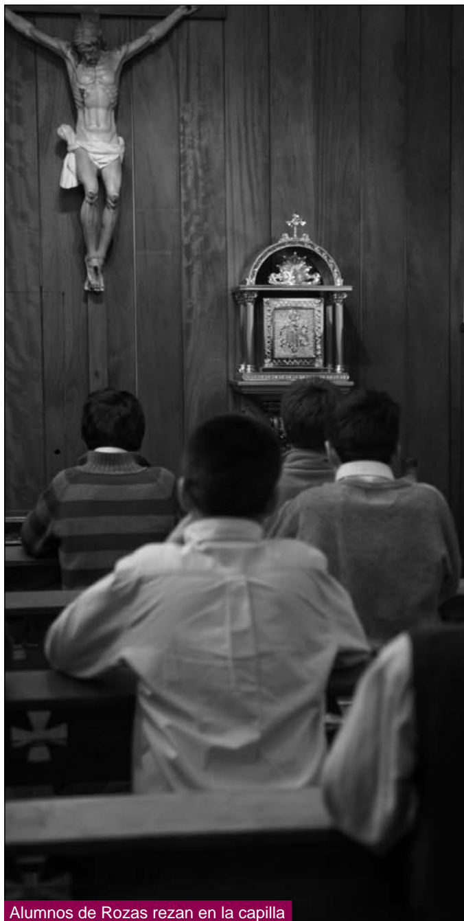
Alumnos de Rozas rezan en la capilla

El estilo educativo de nuestro seminario menor llama la atención: educación diferenciada, centralidad de la fe en Jesucristo, amor a la Iglesia, chicos internos... La presión del ambiente exterior es fuerte a veces, pero queremos tener el coraje de “ser distintos”, de ir por donde tenemos que ir, aunque en ocasiones eso signifique nadar contracorriente. Y parece que los padres y los chicos lo entienden. Éste es, por ejemplo, uno de los pocos centros de la Comunidad de Madrid donde el 100% de las familias presentaron la objeción de conciencia a la asignatura “Educación para la ciudadanía”.