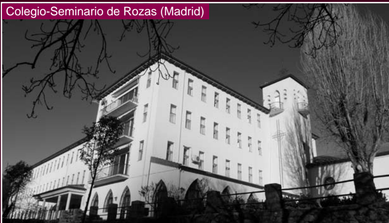
Colegio-Seminario de Rozas (Madrid)

Estos centros desarrollan una labor educativa dirigida a custodiar y desarrollar los brotes de vocación sacerdotal