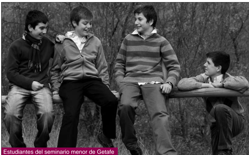
Estudiantes del seminario menor de Getafe

41 seminaristas menores al seminario mayor de Toledo?... Como puede verse, aunque no vaya todo bien, hay sólidos motivos para la esperanza.