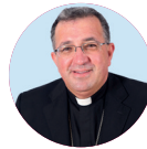
† Ginés García Beltrán Obispo de Getafe

sur de Madrid es una realidad muy rica en personas y realidades eclesiales, pero a la vez hay en ella muchas necesidades de todo orden, por lo que la ayuda económica de todos y el servicio que cada fiel puede realizar es fundamental para que nuestra diócesis sea una luz en estos momentos que para muchos es de oscuridad.