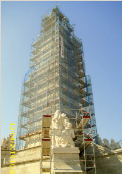
EL SAGRADO CORAZON

BANCO POPULAR 0075 0226 21 0608520 Giro postal Carmelitas Descalzas, Cerro de los Ángeles