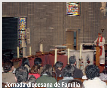
Jornada diocesana de Familia