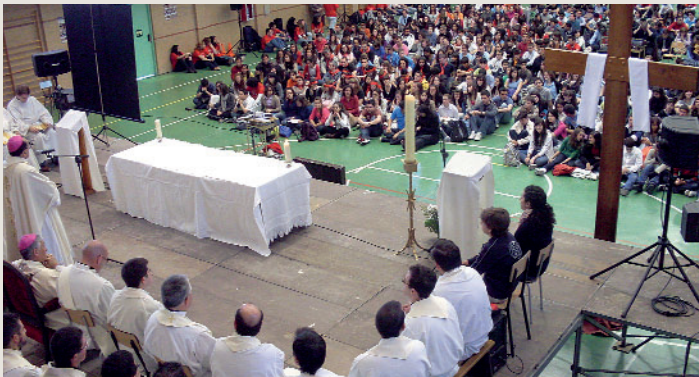
Cientos de jóvenes con la cruz en Getafe.