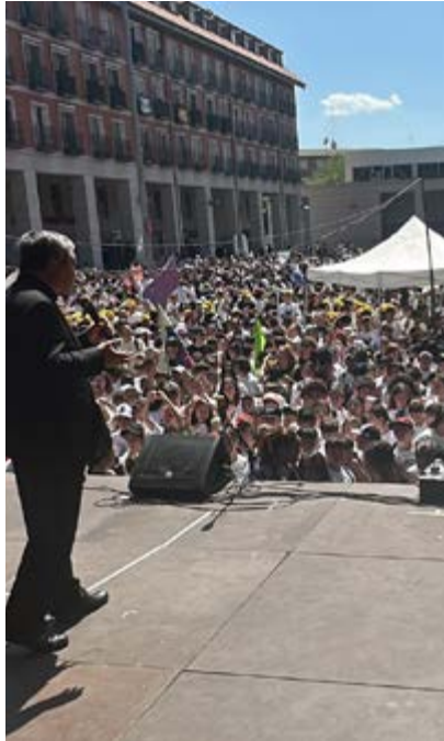
Mons. Auza, dirigiéndose a los jóvenes.

También su mensaje de paz, el interés por el cuidado de la casa común y la fraternidad universal estuvieron presentes en el concierto de Gen Verde, con el que culminó la jornada, organizada por