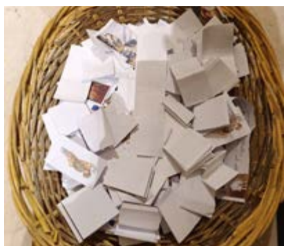
Cesto con los nombres de los no nacidos.

Las familias de la diócesis parten en peregrinación a Roma acompañadas por el obispo para celebrar este acontecimiento.