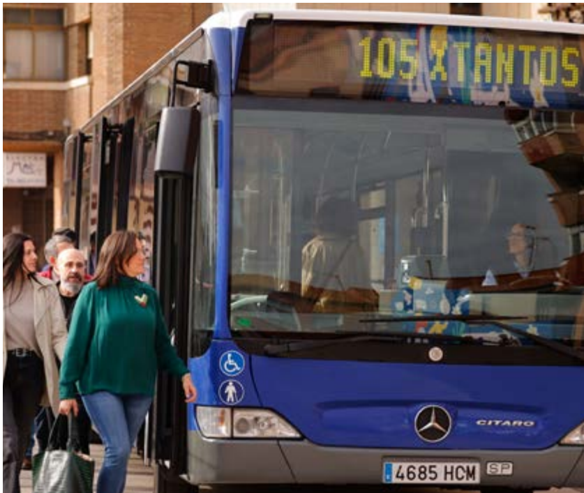
El autobús de la 'Línea 105 Xtantos' que recorre la diócesis.