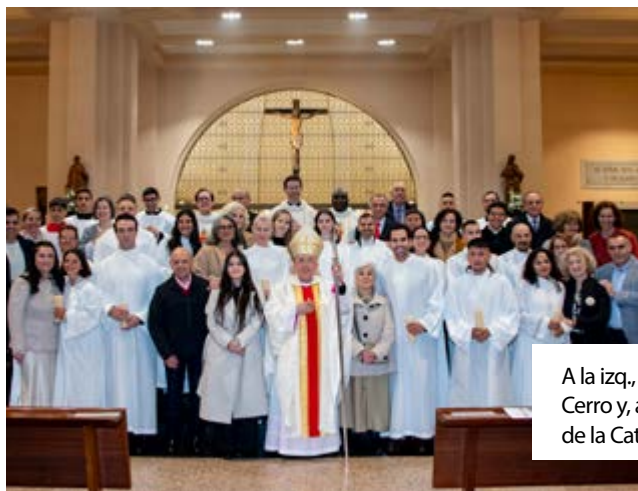
A la izq., el grupo del Cerro y, a la dcha., el de la Catedral.