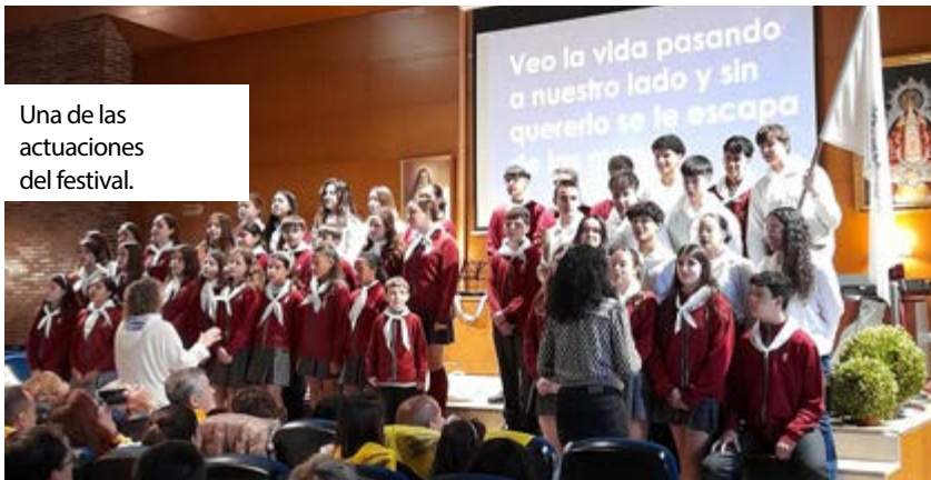
Una de las actuaciones del festival.