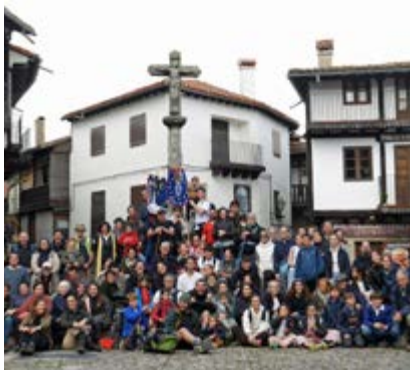
Los peregrinos, en La Alberca.

El nuevo templo, diseñado por el arquitecto Lauro Diezma, destaca por su funcionalidad, su austeridad y por la sostenibilidad. Contará con una nave principal, capilla diaria, salones parroquiales, zonas de servicio y vivienda para el párroco.