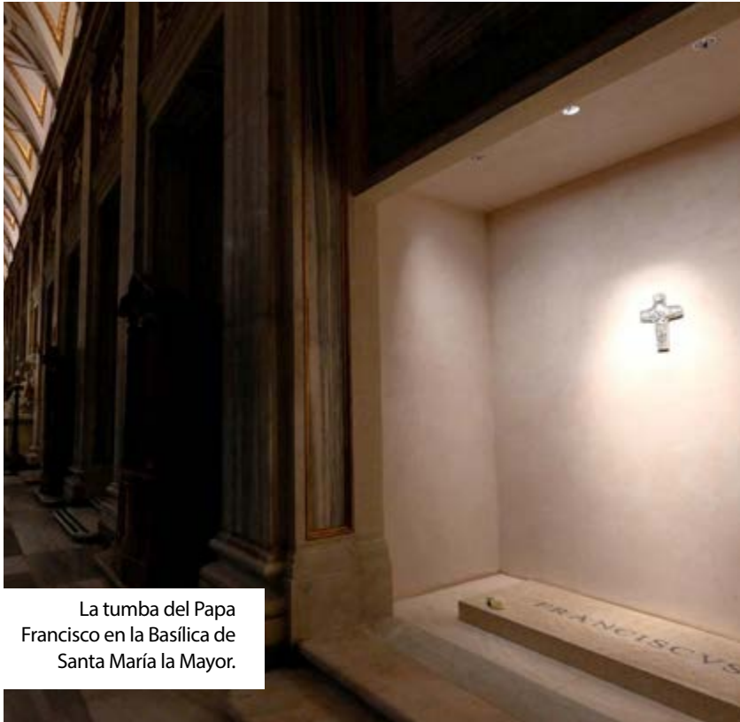
La tumba del Papa Francisco en la Basílica de Santa María la Mayor.