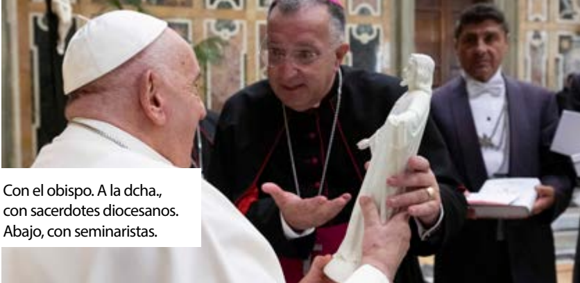
Con el obispo. A la dcha., con sacerdotes diocesanos. Abajo, con seminaristas.