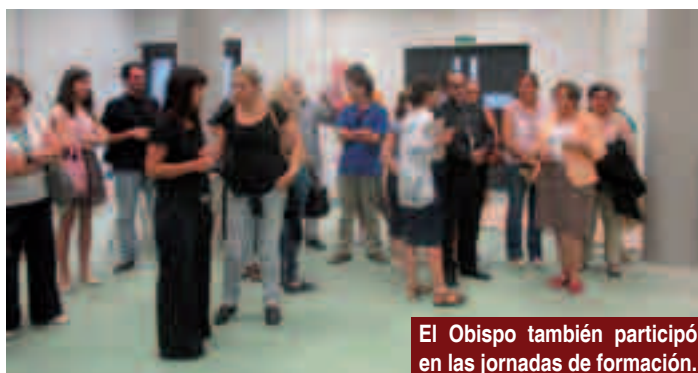
El Obispo también participó en las jornadas de formación.