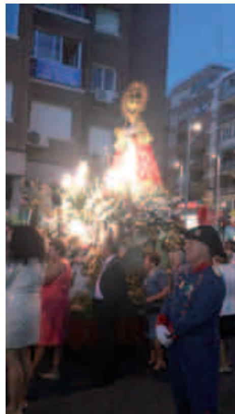
Procesión con la imagen de la Virgen de los Santos

E ra alguno de los piropos que, con devoción y respeto, se gritaba y cantaba a la Virgen María durante las Fiestas Mayores de Septiembre en su Honor y en Conmemoración del V Centenario; como desgranando las cuentas del Rosario, todo eran alabanzas.