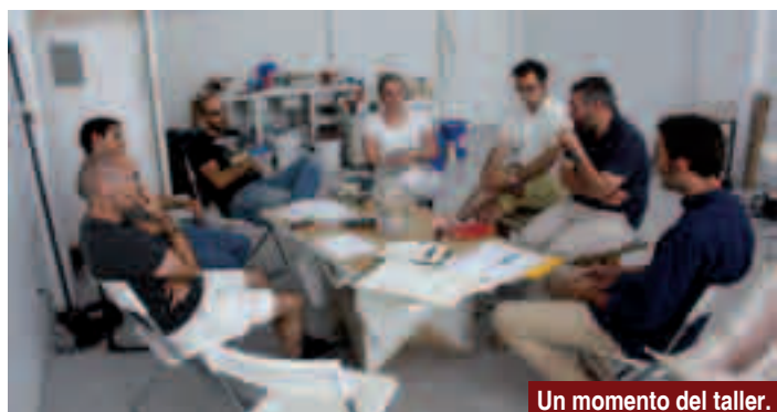
Un momento del taller.