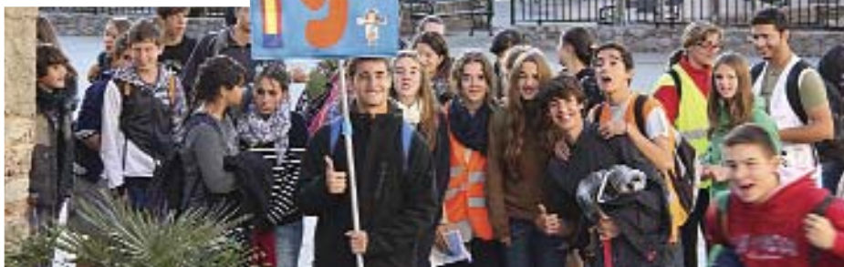
El estandarte del bus de la Parroquia Santo Cristo de la Misericordia (Bañadilla).

Ésta ha sido mi tercera peregrinación. Veníamos con miedo, por la lluvia. Pero el Señor