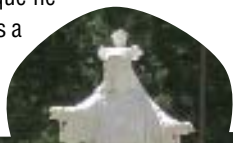
Los participantes de la Escuela junto al Sagrado Corazón que preside el Colegio Seminario de Rozas de Puerto Real