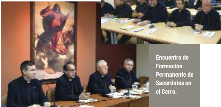
Encuentro de Formación Permanente de Sacerdotes en el Cerro.