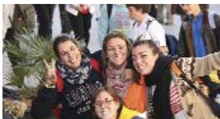
Alegría entre las peregrinas de Villaviciosa de Odón

maravilla ver a tantos jóvenes, entrando en Guadalupe cantando y saltando.